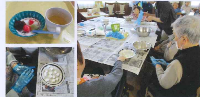
おやつ作り 毎週1回、お菓子づくりを楽しんでいます。