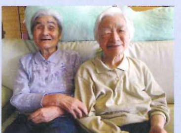
いつも仲良しのお二人さんです