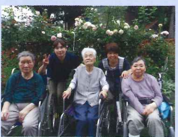
満開のバラ庭園でパチ!!