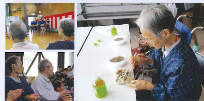
ふれあい学園収穫祭

新庄北高最上校の生徒の皆さんによるクリーン作戦。きれいにさせていただきました。ありがとうございます。