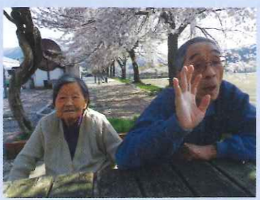
桜花満開の下、会話はあみまあ