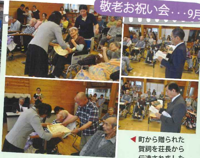
◀町から贈られた賀詞を荘長から伝達されました。