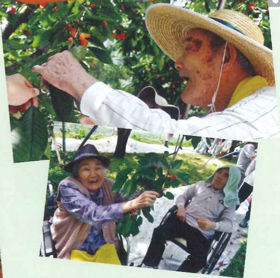
▲ふれあい学園のさくらんぼ畑までバスでお出かけ。おいしいさくらんぼを、たくさんいただきました。