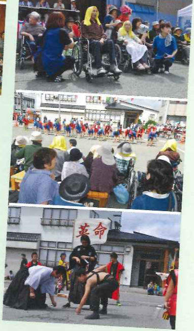
▲最上祭の仮装パレードを観覧しました。本部前の特等席をご用意いただきさまざまな仮装を楽しみました。