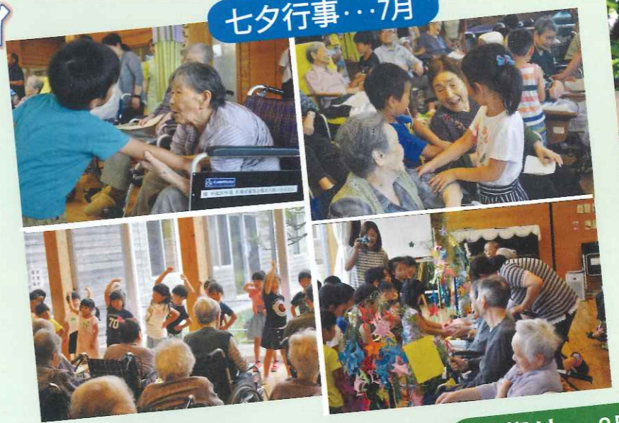
▲あたごこども園の子どもたちが、お歌や踊りを披露してくれました。子どもたちとのふれあいに元気をもらい笑顔いっぱいの入居者様でした。