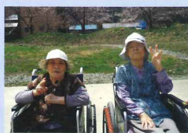
カメラに向かって思わぬピースサイン