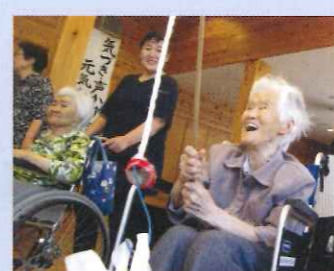
てっがいお宝を釣ってくださいね