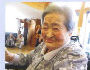
はいチーズ!!ステキな笑顔に撮れましたね