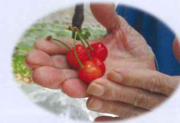
ふれあい学園でのさくらんぼ狩り

毎年、ふれあい学園のさくらんぼ園に出かけています。今年もたくさんいただきました。