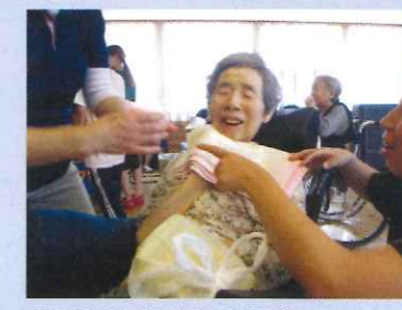
アイスはいかがですか