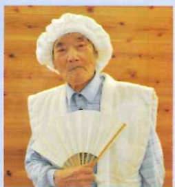
扇子も手にはいポーズ 染まってまあげ!!