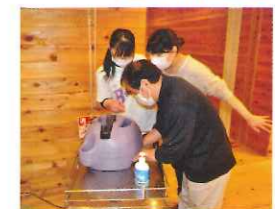
感染症対策講習会