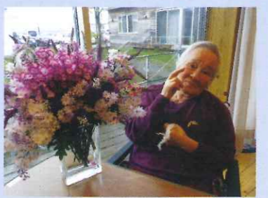
きれいなお花にうっつい