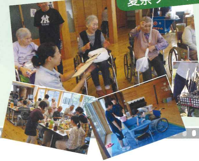
◀家族会の協力のもと、鮎のつかみ捕り大会や鮎焼き、宝釣りなどで、大いに盛りあげられました。