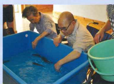
真剣そのもの!! 魚のつかみどい