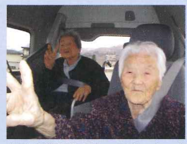
ドライブに出発!いってらっしゃい