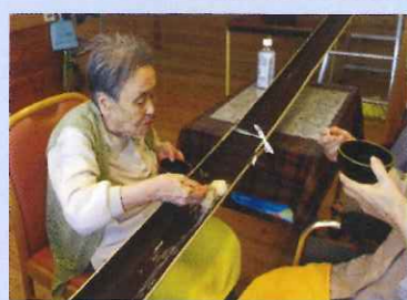
流しソーメン お上手であげ!!